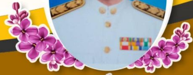
นายดำรงศักดิ์ หงษ์ทะนี ผู้อำนวยการศูนย์วิจัยและพัฒนาอาหารสัตว์อีสาน

ฉบับที่ 5 ปีที่ 3 ประจำวันที่ 15 กุมภาพันธ์ 2566